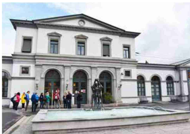
Es gibt nur einen ersten Eindruck: Um diesen zu verbessern, wird die Eingangshalle am Bahnhof Bad Ragaz nach dem Rückbau der alten WCs neu ausgestattet.