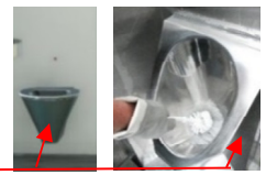
Nettoyage intérieur avec la brosse WC