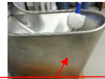
Nettoyage intérieur avec la tête de loup

⚠ Utiliser uniquement des éponges avec un côté abrasif blanc!